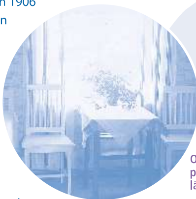
Oulun Valkonauha perusti 1930 yömajan lähelle rautatieasemaa.

Vuonna 1913 yhdistys perusti Vankeinhoi-toyhdistyksen ja Diakonissakodin kanssa työnvälitystoimiston, joka etsi työpaikkoja