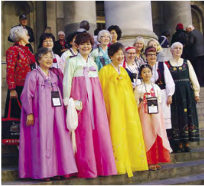
Osanottajia Etelä-Australian parlamentin portailla.