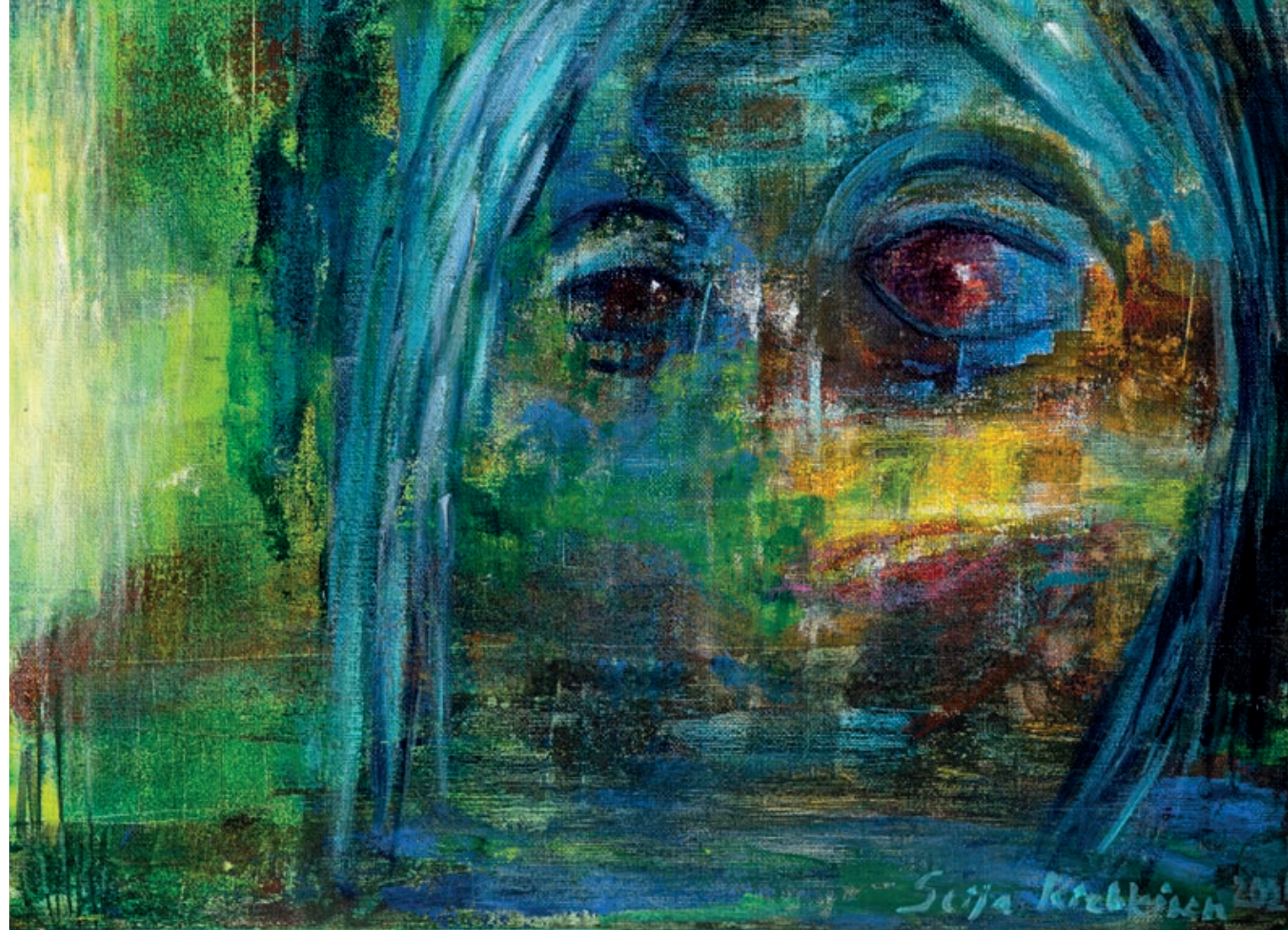
”Viides päivä” (Seija Riekkinen)

Erytisesti hädän ja murheen hetkellä tarvitsemme Jumalan lempeyttä meitä kohtaan. Suuressa murheessa, kun voimamme ovat lopussa, rukouksemme on usein sanatonta koko olemuksestamme nousevaa huokausta. Silloin meillä itsellemme on tuskin ollenkaan sanoja tai selkeitä ajatuksia. Jumalan lempeys näinä hetkinä voi olla sitä, että lähellämme on tuolloin ihmisiä, jotka rukoilevat puolestamme, siunaavat meitä ja auttavat elämässä eteenpäin.