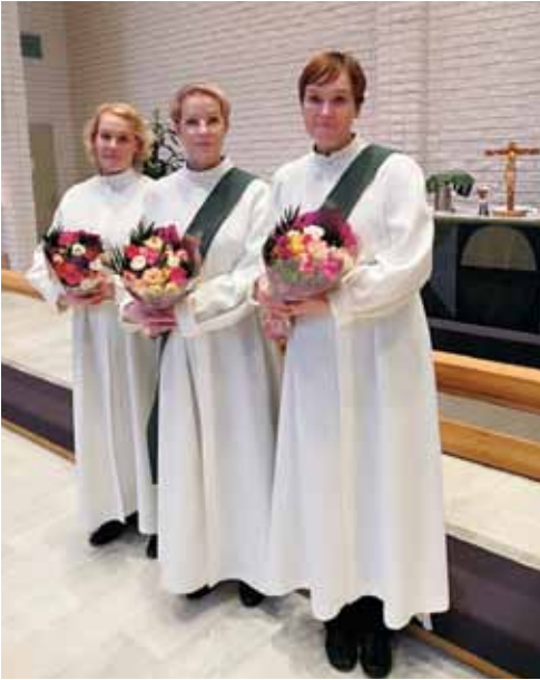
Ertisidiakonian virkaan siunaaminen tammikuussa 2023.

ja läsnäoloa, kuulumista muiden ihmisten joukkoon.