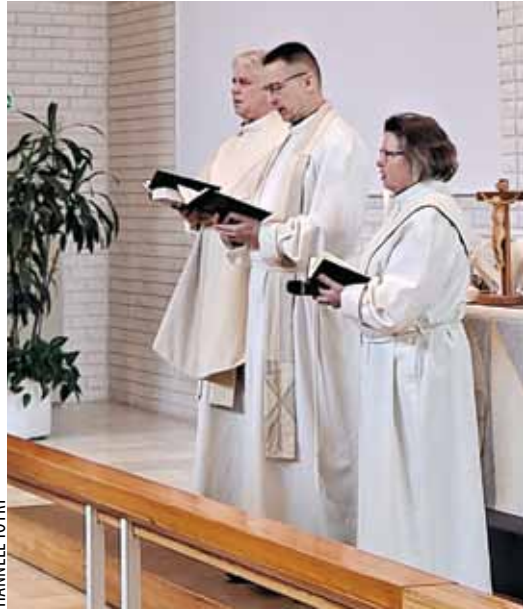
Diakoniatyö lähtee alttarilta.

Diakonian käytännön työ voi olla mm. rinnalla kulkemista, palveluohjausta ja vapaaehtoistyön järjestämistä. Se voi olla Yhteisvastuukeräyksen järjestämistä tai diakoniakasvatusta. Diakoniatyöntekijän työ on hyvin monipuolista; milloin olet roudari, kokki, tsemppari – ja joskus saat istua vaikkapa nuotiolla kuunnellen ihmisten elämäntarinoita. Kallaveden seurakunnassa työskentelevät päihdetyön-, mielenterveys- ja kriminaalityön diakonit ovat kokoamassa myös koko seurakuntayhtymän alueella mm. päihetisiini kuolleiden läheisten sururyhmää.