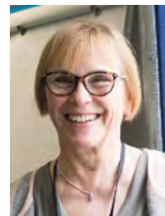
Kirjoittaja on Helsingin Akateemiset Naiset ry:n puheenjohtaja Suomen Akateemisten Naisten liitto, hallituksen jäsen.

Samansuuntaisia ajatuksia tulevaisuudesta sisälsi tasavallan presidentti Sauli Niinistön Yhteisvastuukeräyksen avauspuhe (3.2.2019), jossa hän korosti koulutuksen merkitystä kansallisella ja kansainväliselläkin tasolla. ”Koulutus muuttaa maailmaa. Se tietää parempaa elämää yksittäisille ihmisille, hyvinvointia kokonaisille maille ja kehitystä koko ihmiskunnalle. Koulutus ja tasa-arvo kouluun pääsemisessä on reitti kehitykseen ja sitä kautta köyhyyden poistamiseen.”