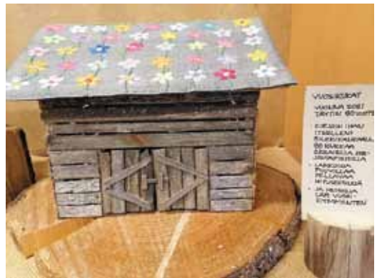
80 vuotta ja yhtä monta kukkaa silkikankaisella katolla.