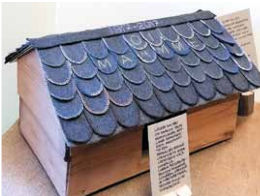
Suomen 100-vuotisjuhlan kunniaksi valmistui ensimmäinen lato.

Kirjoittaja on eläkkeellä oleva käsityönopettaja, Iitti.