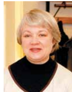
Laatinut FM Tuija Viestilä

Vastaukset löydät tämän lehden sivulta 38. Nämä ja lisää tehtäviä löydät kirjastani Kielikiipeiltä (Finn Lectura 2017).