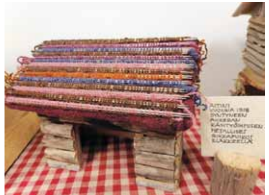
Kirjoittajan v. 1918 syntyneen äidin metalliset sukkapuikot pääsivät "eläkkeellä" ladon katoksi.