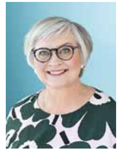
Kirjoittaja on eduskunnan puhemies.

Kiitos työstänne valon ja toivon vahvistamiseksi!