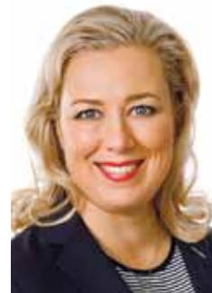
Kirjoittaja on EU-komissaari.

Viime aikoina on puhuttu paljon yhteiskuntien vastustuskyvystä. Ikävä kyllä koronavirus ei ole viimeinen kriisi, jonka tuleamme kohtaamaan. Vastustuskykymme on siis vahvistettava. Aidosti kestävä kehitys nimittäin edellyttää sekä sosiaalisen, ympäristöllisen että taloudellisen kestävyuden huomiointia.