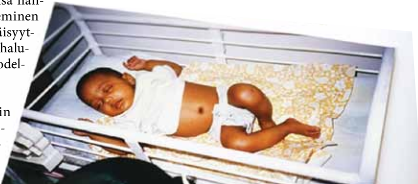
Odotus oli kestänyt melkein kymmenen vuotta, mutta nyt kaikki tapahtui äkkiä. Ensimmäiset kuvat tulivat Intiasta. Yhdessä kuvassa pieni, tumma vauva makaa valkoisessa sängyssä.

Adoptiovanhemmalle oman lapsen syyliin saamisen polku on hyvin erilainen, vaikka toive lapsesta onkin kaikille vanhemmaksi haluaville sama. Adoptiovanhemmat ovat käyneet yleensä jo hyvin raskaan tien ymmärtäessään, ettei biologiseen lapseen ole mahdollisuutta. Kuva konkretisoi tulevien vanhempien odotuksen, adoptiovanhemmilla se on mustavalkoisen ultrakuvan sijaan otos jo syntyneestä ihmeestä.