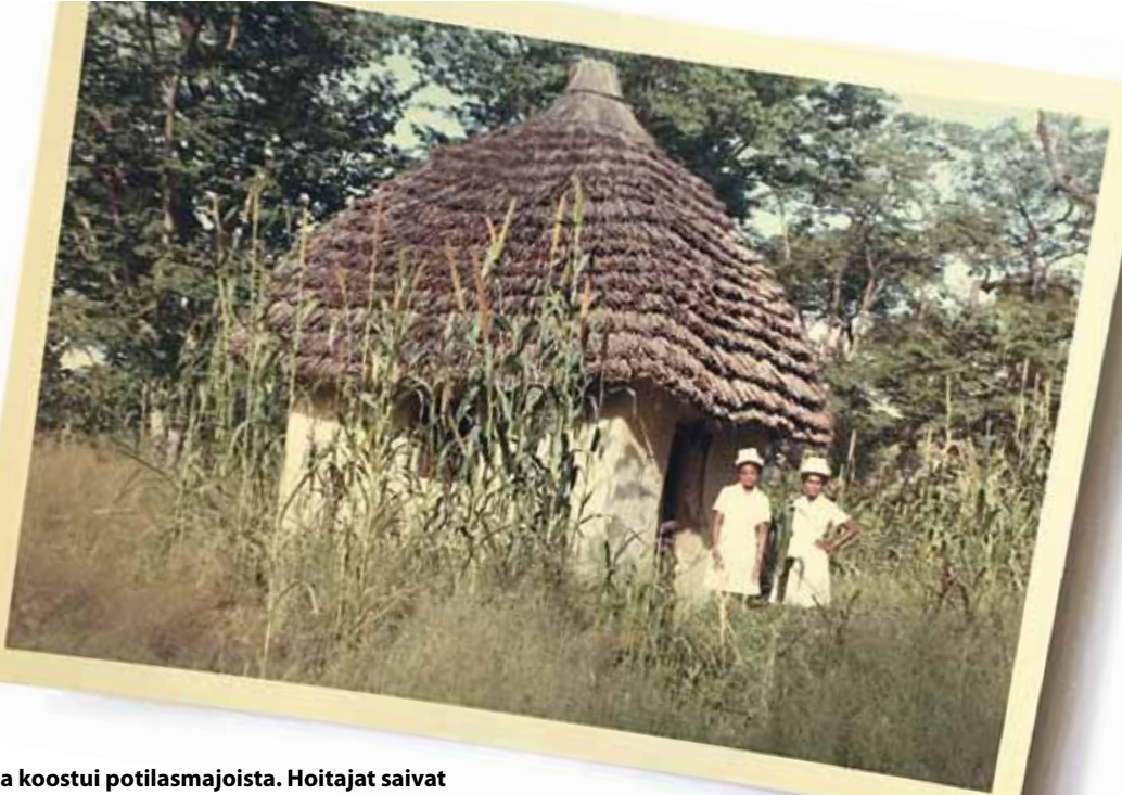
Sairaala koostui potilasmajoista. Hoitajat saivat koulutuksen klinikoillamme.

tuolloin omilla rajatuilla alueilla reservateissa eli bantustaneissa.