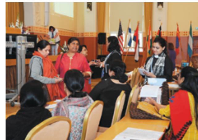
Intian Valkonauhan edustajat valmistautuvat esitykseensä.

seva linja myös jokaisen yksittäisen jäsenen mielipide.