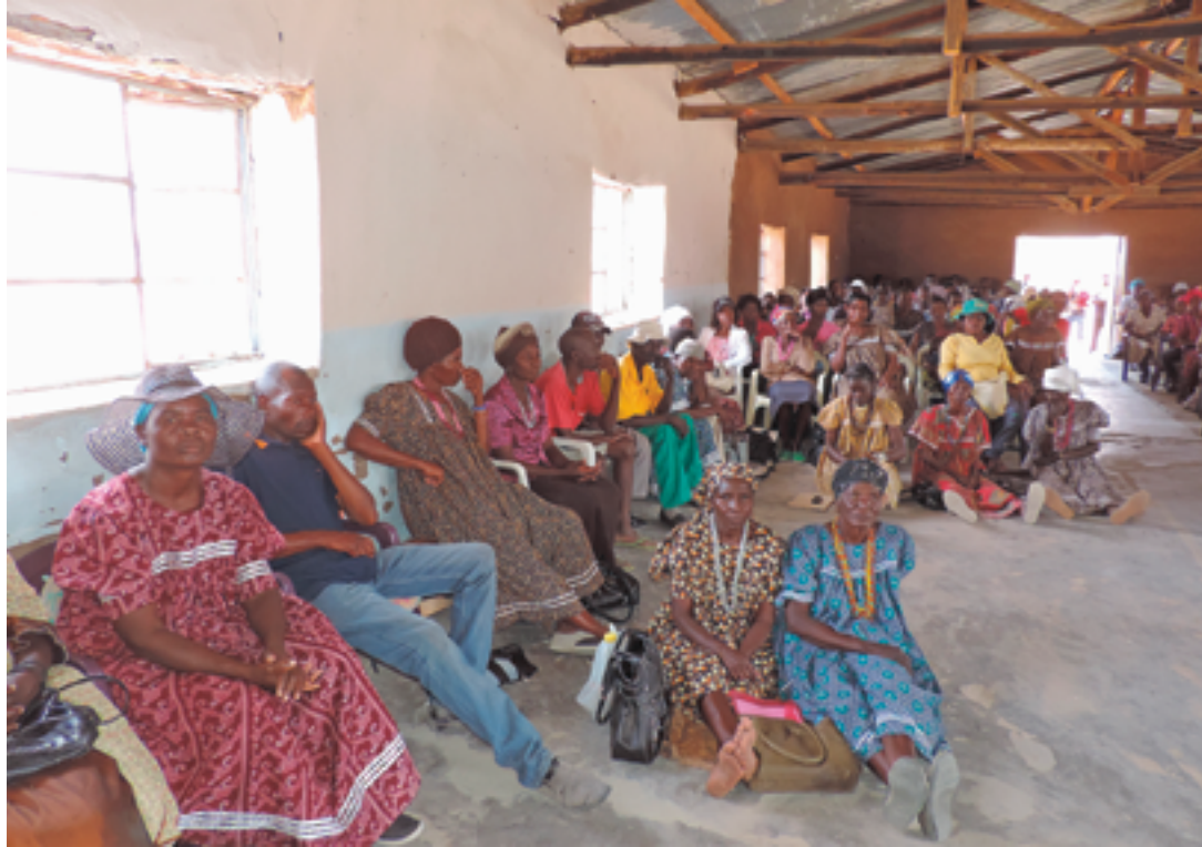
Kuva Kunenelta Pohjois-Namibiasta.

män. Olethan lohdutuksena, toivona ja lähellä meitä kaikkia.” Tärkeää oli, että ihmiset yhdessä kantoivat toistensa kuormia.