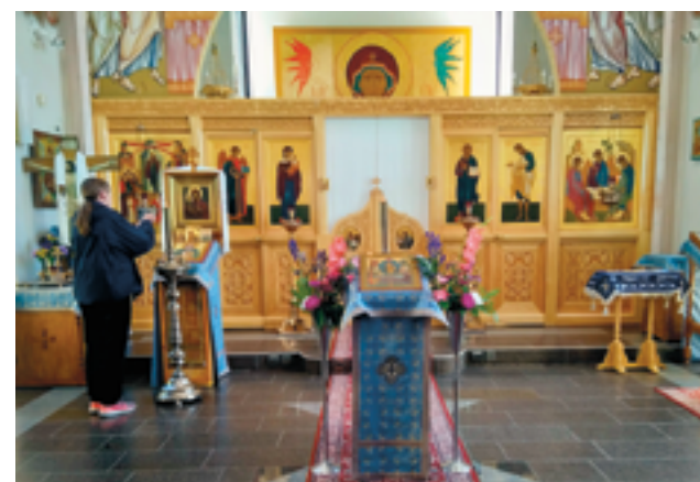
Lintulan luostarin kirkossa. Vas. ylhäällä kattolamppu vanhasta Valamosta nykyisen Valamon pääkirkossa. Vas. alhaalla Valamon pääkirkko.