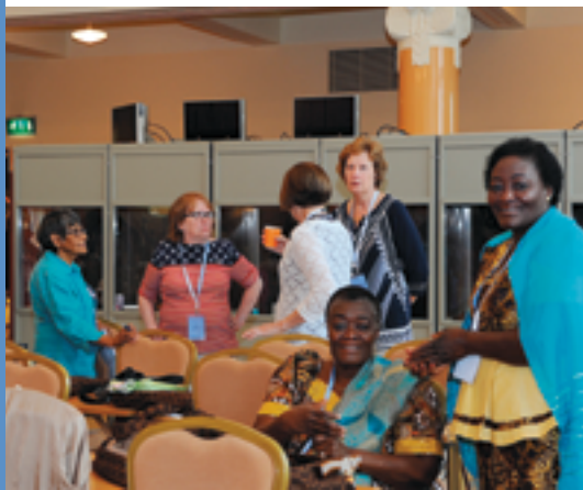
Kongressisalissa vallitsi iloinen ja innostunut tunnelma.