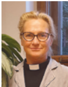
Kirjoittaja on Helsingin tuomiokirkkoseurakunnan johtava kappalainen.

Nyt kun siirrän katseeni menneestä tulevaan, tahdon nähdä siellä kirkon, joka elää ja toimii ihmisten keskellä. Kirkon, joka kokoaa ja lähettää taas eteenpäin. Kirkon, joka rohkaisee ja siunaa ja jossa kannamme toinen toistamme. Kirkon, johon tullaan yhteen, pois sieltä oman elämän kaihtimen takaa. Tätä toivon, kun katson polkua eteenpäin.