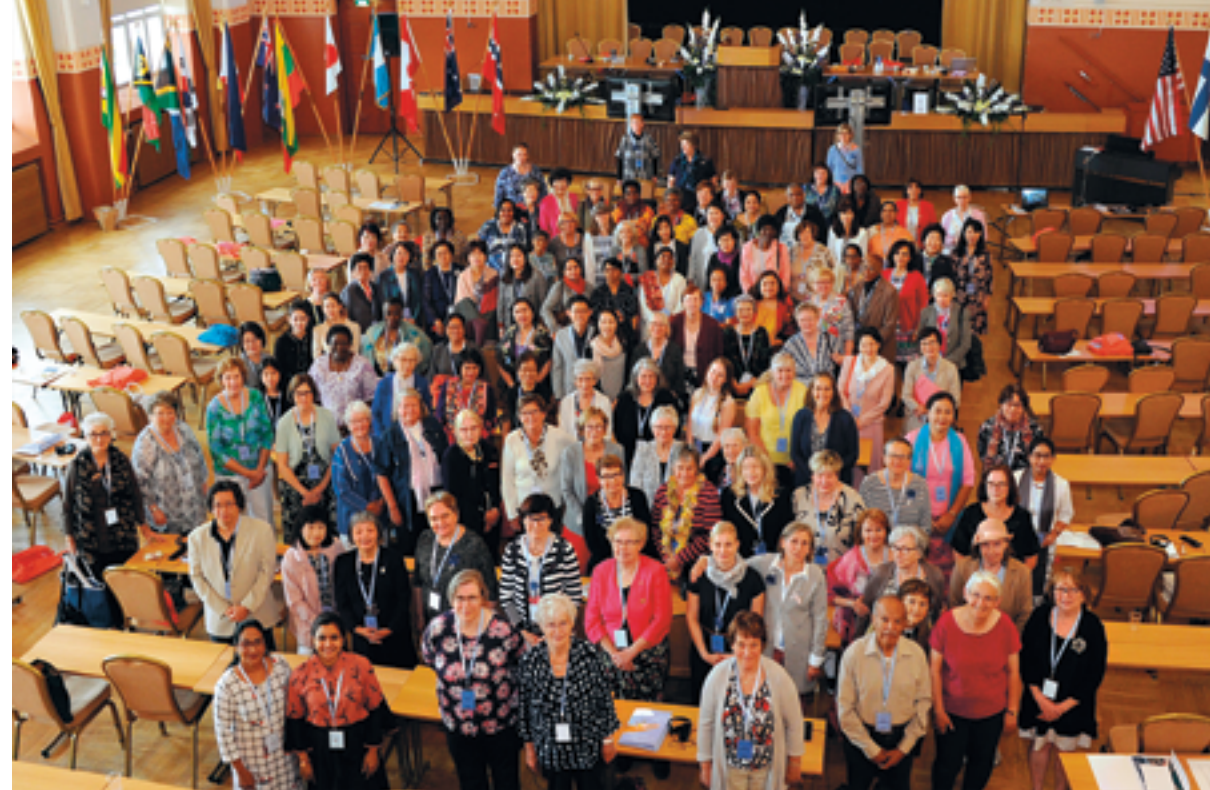
Kongressipäivien osanottajajoukko vaihteli, sillä osa suomalaisista edustajista pystyi osallistumaan aikataulusyistä vain joihinkin päiviin. Kuvassa osanottajat kuvattuina Paasitornin parvelta.