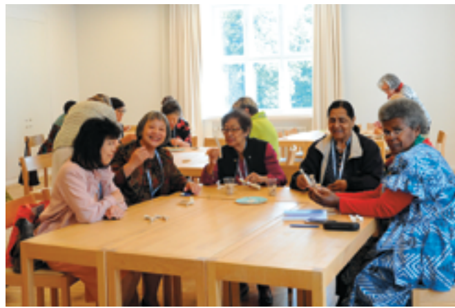
Japanin, Filippiinien, Intian ja Vanuatun edustajat askartelivat enkeli-työpajassa.