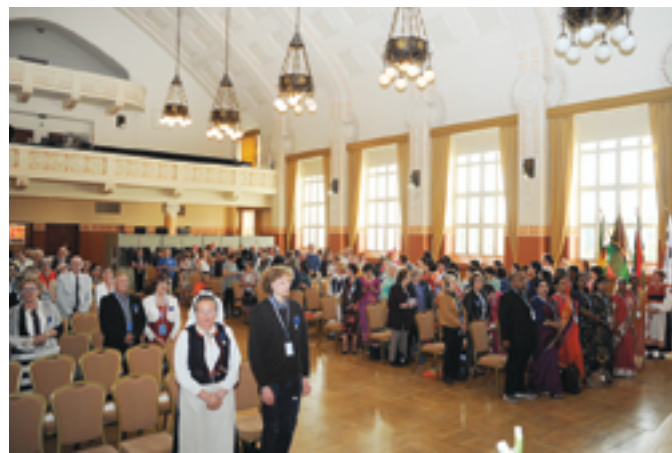
Avajaisissa oli juhlava, mutta lämmin tunnelma.