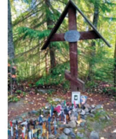
Kävimme Pentti Saarikosken haudalla.