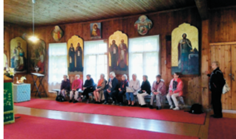
Tutustuimme oppaan johdolla kirkkoihin. Kuvassa Valamon vanha kirkko.