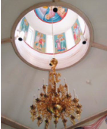
Teksti ja kuvat PIRJO SIPILÄ