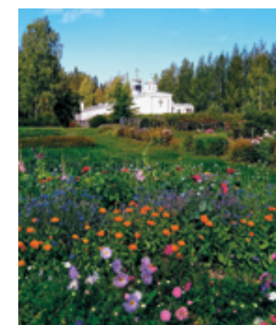
Kesäkukat hehkuivat väriloistos-saan Lintulan luostarissa.

Hyvät kahvit ja pullat saattelivat meidät kotimat-kalle Lintulasta, vaikka kävimmekin vielä lounastamassa Mikkelin tunnetussa lounas- ja leivon-naispaikassa Siistosella.