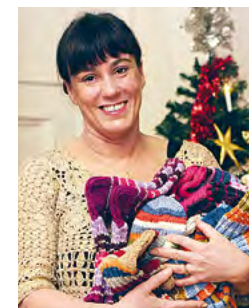
Kirjoittaja on Liisankodin johtaja.

Meillä kaikilla on oman elämämme kom- posti eri vaiheessa. Joku vasta suunnitte- lee sen perustamista, jollain toisella taas on jo hyvää multaa johon istuttaa siemeniä. Eräillä on jo satoa tuottava kukka- penkki, pelto tai puutarha ja joku tarjo- aa jo leipomastaan leivästä hyvää kaikkien iloksi. Näis- sä kaikissa vaiheissa saamme tukea toinen toistamme, yh- dessä kasvaen ja kasvattaen. Kukin vuorollaan antaa ja ottaa vastaan. Tämä on Liis- ankodin joulun ihme.