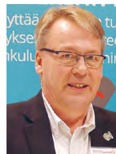
Kirjoittaja on Saunamestari Kilta ry:n puheenjohtaja.

Toivottaen kaikille hyvää Joulurauhaa Joulusaunan kera!