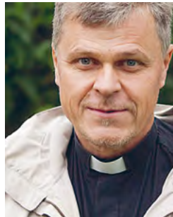
Kirjoittaja työkentelee kirkkoherrana Haminan seurakunnassa.

Pari vuotta sitten löysin vanhan tavaran liikkeestä lippunauhatarpeet. Nyt liput koristavat omaa joulupuuta. Mihin koristeeseen tai esineeseen sinulla liittyy erityisiä joulumuistoja ja tunteita?