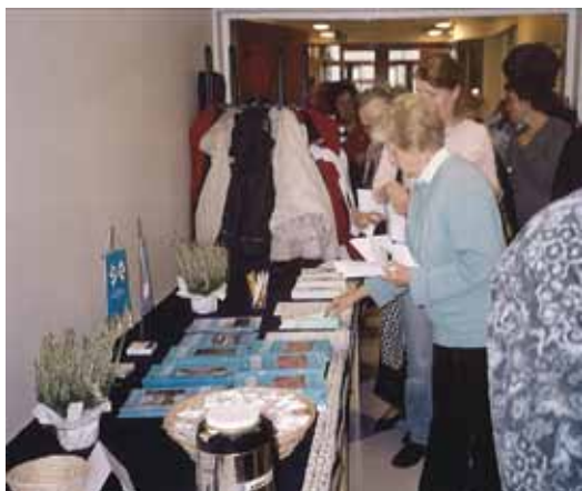
Eri yhdistysten esittelytilaisuudessa olimme mukana omalla info-pöydällä.