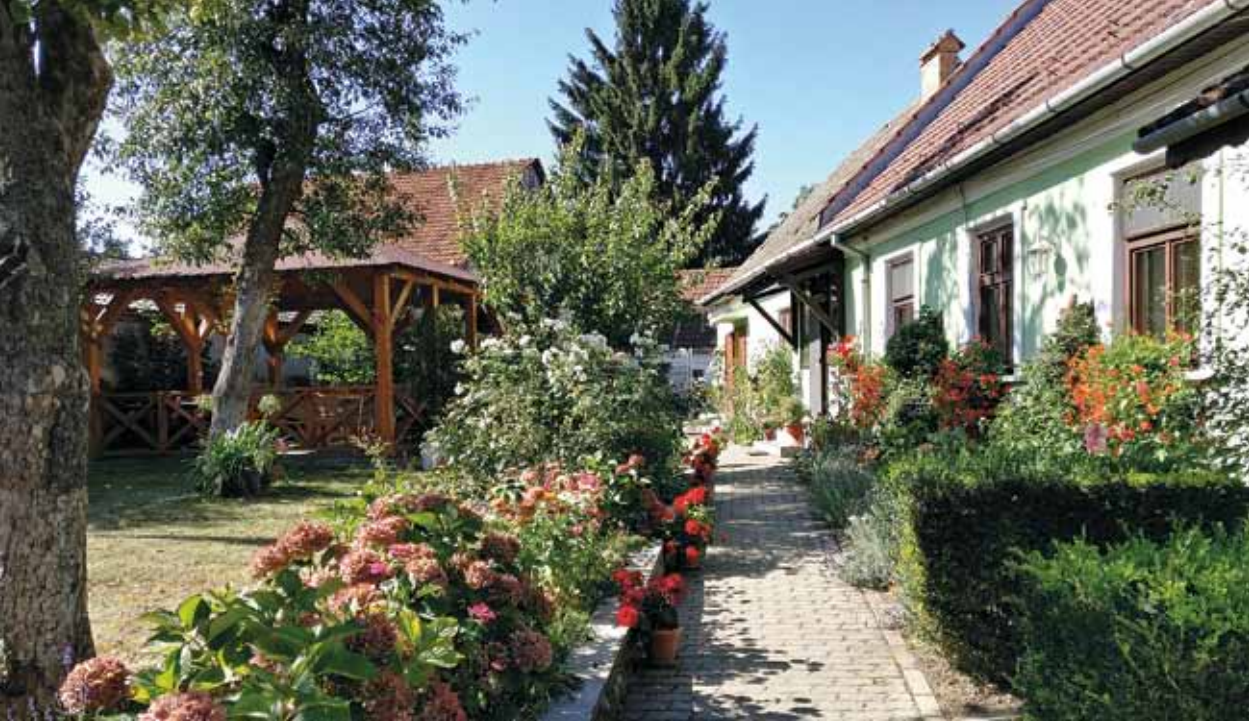
Pappila oli hyvinhoidettu kauniine puutarhoineen..

taloudellisesti luterilaisia seurakuntia ja EU:lta saadaan investointiavustuksia historiallisten kirkkorakennusten kunnostamiseen. Unkarinkieliset saavat myös automaattisesti kaksoiskansalaisuuden (sekä Unkarin että Romanian), jolloin unkarinkieliset voivat äänestää myös Unkarin valtiollisissa vaaleissa. Teologisessa instituutissa oli tällä hetkellä vain kolme luterilaista opiskelijaa. Määrä on romahtanut, sillä 10 vuotta sitten heitä oli yli 300. Romaniassa käydään kilpailua myös ihmisten arvoista, markkinatalous ja työ vähemmistökirkon pappina eivät välttämättä kohtaa. On myös tärkeää muistaa, että Romanian valtakirkko on ortodoksinen kirkko, joka tekee varsin jouhevaa yhteistyötä valtaapitävien kanssa.