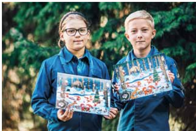
Partiolaisten adventtikalenteri painetaan Hämeenlinnassa ympäristöystävälliselle kartongille ja se on Avainlippu-tuote.

Partiolaisille adventtikalenterimyynni on vuoden tärkein varainhankintakampanja. Adventtikalenterimyynnin tuotoilla partiolaiset hankkivat esimerkiksi retkei-