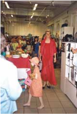
Oululainen firma Meri-maaria juhlisti 100-vuotista toimintaamme järjestämällä Marimekon muotinäytöksen.