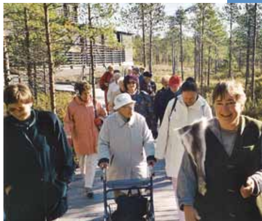
Retki Yli-lin Kierikin kivikautiseen kylään Aurinkokodin vanhusten kanssa.