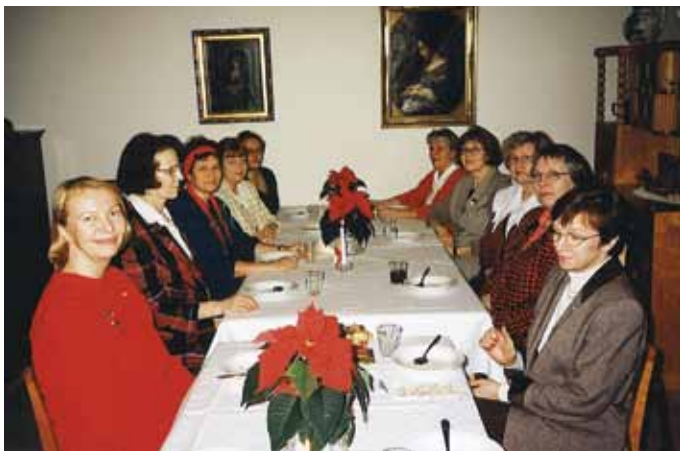
Joulupuurolla Aurinkokodissa, jossa kokoontuimme yli 20 vuotta.