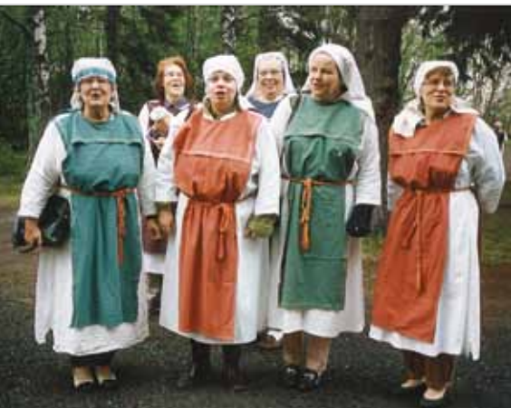
Valkonauhasisaret viikinkiajan tunnelmissa Haukiputaalla. Nautimme perinteisen viikinki-illallisen.

Yhdistystoiminnan tärkeä osa on jäsenistön voimaannuttaminen. Yhteisen tekemisen ja virkistytymisen avulla luomme toimintaan kannustavan ja hyvän ilmapiirin. Muistelemme kuvien myötä yhteisiä tapahtumia Oulun Valkonauhan taipaleelta.