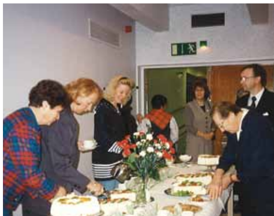
Vuonna 1996 vietimme Oulun Valkonauha ry:n 90-vuotisjuhlia Keskustan seurakuntakodissa.