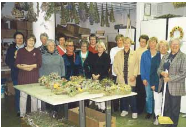
Luovat kykymme pääsivät valloilleen kuivakukkakurssilla.