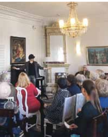
Keväisin järjestämme kauniissa Oulun Vanhassa pappilassa suositun hyväntekeväisyyskonsertin. Esiintyjinä ovat olleet Oulun konservatorion oppilaat.