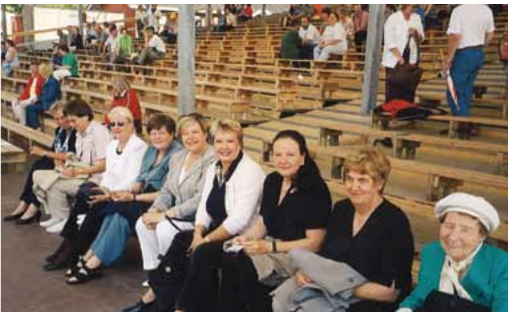
Väljajalla kesäteatterissa Oulun Toppilansalmen Möljällä.