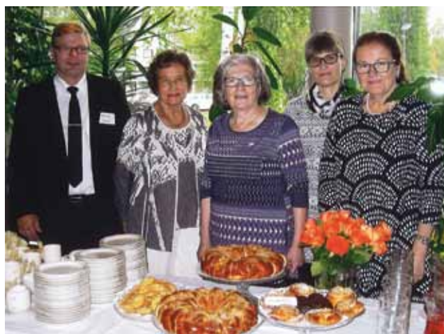
Kuvassa olemme Tuiran kirkossa järjestämässä kirkkokahveja.