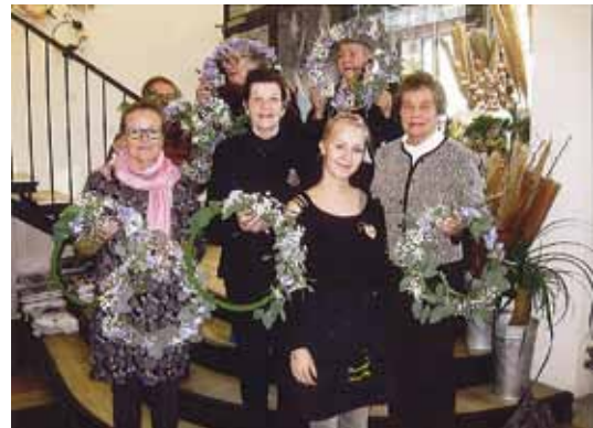
Jäsenistöme toiveesta uusimme kuivakukkurssin. Ohjaajana toimi kukkakauppa Kanervan floristi.