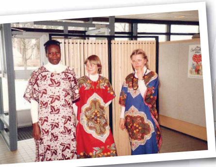
Menette sai SLS:n stipendin ja tuli Suomeen opiskelemaan musiikkia Raudaskylässä lukuvuoden 1985–86. Myöhemmin hän oli pappiskurssilla Shangalala-Instituutissa ja vihittiin papiksi 2002.