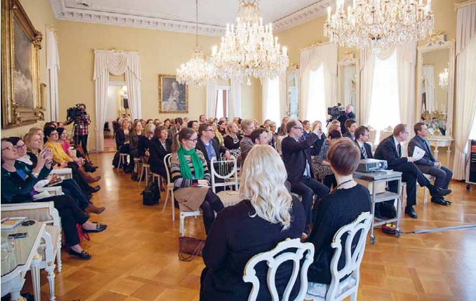
Lapsiasiavaltuutetun Vuosikirjan julkistamistilaisuus pidettiin valtioneuvoston juhlahuoneistossa Smolnassa 27.3.2015.