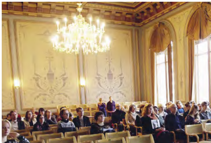
Kaupungintalon juhlasali täyttyi kiinnostuneista kuulijoista.