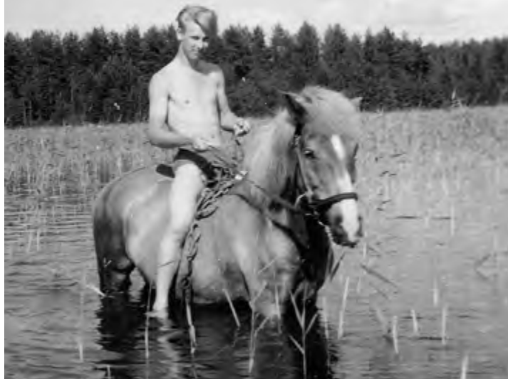
Kirjoittajan isä uittaa hevosta 1950-luvun lopulla.

vat vielä kesken ja vika löytämättä. Nyt oltiin siinä, letkujen, tipan ja sairaalahuoneen neutraalin puhtauden kanssa. Isä ja poika sekä muistot.