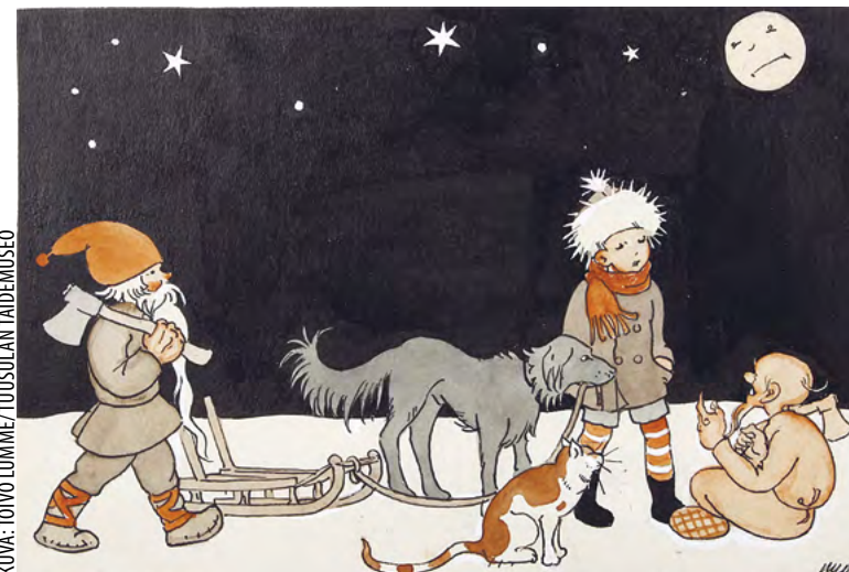
Jukka-Pekka toimittaa Kuu-ukolle joulukuusen, kuviutus Aili Somersalon satuun lehdessä Sirkan Joulu, peiteväri ja tussi, 1929.

turhamainen prinsessa katsoo kuvajais-taan lammen pinnalla pudottaen kohta helmensä ja kadottaen siten muistinsa ja prinsessallisen loistonsa.