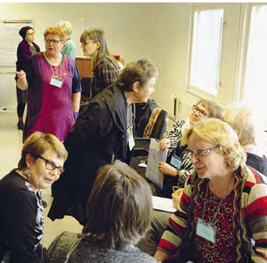
Päivän aikana työskenneltiin erilaisissa ryhmissä.

Ennen kotiin lähtöä pidettiin vielä palauttekeskustelu, jossa oli mahdollisuus jättää palautetta päivien toteutuksesta.