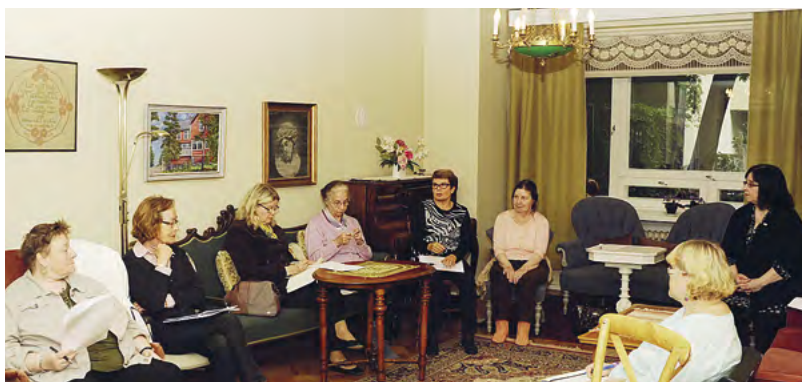
Helsingin seminaari järjestettiin Valkonauhasäätien tiloissa. Saman teeman ympärillä on kuluvana vuonna kokoonnuttu kahdeksalla eri paikkakunnalla.