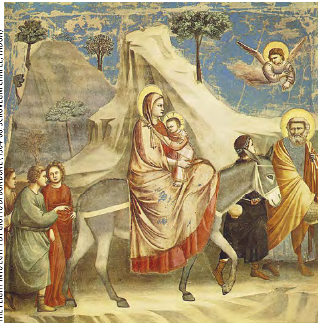
THE FLIGHT INTO EGYPT BY GIOTTO DI BONDONE (1304-06, SCROVEGNI CHAPEL, PADUA)

Tietäjät näkivät tähden seisahduttavan ja suuri ilo täytti heidän sydämensä: me saamme pian nähdä kuninkaan! He menivät sisälle taloon ja näkivät lapsen ja Marian. Polvistuen Jeesuksen eteen he antoivat hänelle lahjansa. Vanhan perimätiedon mukaan tietäjiä kutsutaan kolmeksi kuninkaaksi idästä tai kolmeksi viisaaksi mieheksi. Raamattu ei mainitse tietäjien lukumäärää, mutta nämä an-