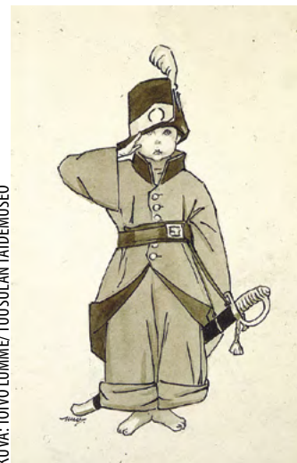
Pikku Matti, sisäkuviutus kirjaan Horma–Huntuvuori–Saarimaan ”Kansakoulun lukukirja”, tussi ja peiteväri 1929.

tunnelmia. Swanin omissa saduissa oli 1890-luvun kirjallisuuden ja kuvataiteen symbolismin vaikutusta – ihmisen sisäisen sielun tunnelman kuvauksia – ja jotain lienee tähänkin jännittävään kuviutukseen siirtynyt. Larssonmainen ak-