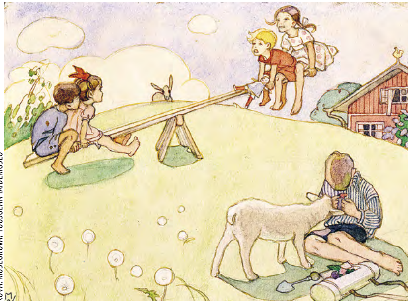
Keinussa, sisäkuviutus Joulukukka-lehteen, akvarelli 1918.

varellin käyttö on muuttunut guassimaiseksi ja vahvat ääriiviivat viittaavat edelleen japanilaisiin puupiirokseen. Kuvan tekstinä oli