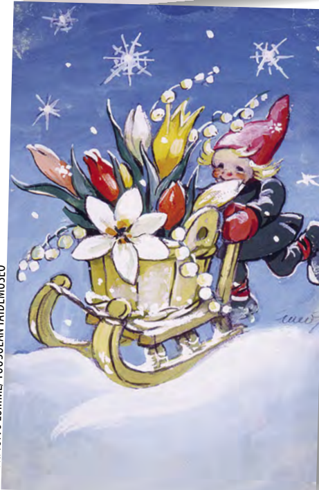
VALOK. TOIVO LUMME/TUUSULAN TAIDEMUSEO